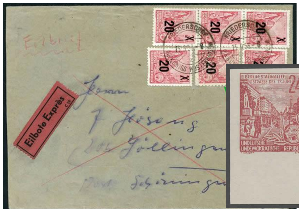
Lettre par exprès de Friedersdorf (Thuringe en RDA) pour Sollingen über Schöninge Braunshw. (Basse Saxe en RFA), départ 15/9/56, transit Berlin 15/9 arrivée Sollingen 16/9